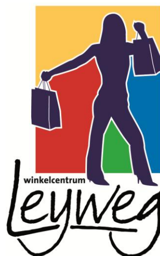
Afbeelding 1. Aankondiging werkzaamheden winkelgebied Leyweg.

Vanuit de Tinaarlostraat leggen we leidingen aan richting de Leyweg. We steken de Leyweg over tot aan de Tubbergenstraat, zie rode lijn op afbeelding 2.