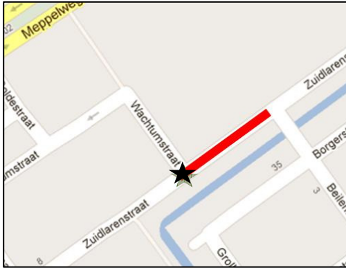
Afbeelding 2. Fase 2.

Gedurende fase 2 worden leidingen gelegd en getest. Dit gedeelte van de Zuidlarenstraat en het kruispunt Wachstumstraat – Zuidlarenstraat, zie zwart ster, zijn tijdelijk niet toegankelijk voor verkeer.