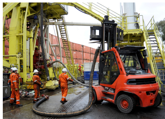
Afbeelding 1. Werkzaamheden boorlocatie oktober

Aardwarmte Den Haag boort twee putten; één om het warme water mee omhoog te pompen en één om het afgekoelde water terug de aarde in te pompen. In oktober is boormaatschappij NDDC druk bezig geweest met de boring van de tweede put. Hier is vorige week de beoogde diepte van ruim twee kilometer bereikt. Op 3 en 4 november is de bron getest op de warmte van het aardwater en de hoeveelheid water dat kan worden opgepompt. De uitkomsten zijn positief en dat betekent dat de aardwarmteboring in zijn totaliteit succesvol is.