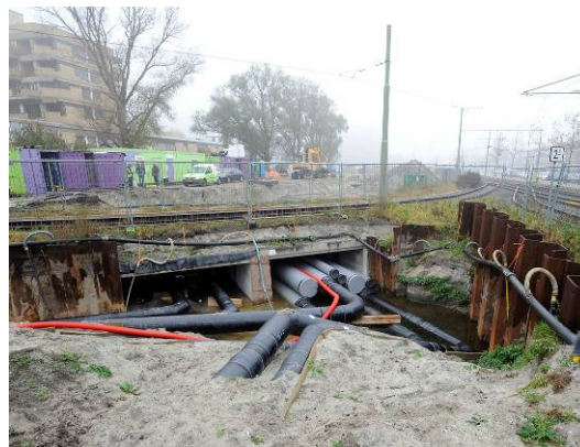
Afb. 1 Aardwarmte Den Haag legt leidingen en kabels tussen de aardwarmtebron en de –centrale. Deze werkzaamheden zijn voor de kerst afgerond.

Van maandag 26 december tot en met vrijdag 31 december voert Aardwarmte Den Haag geen werkzaamheden uit langs de Leyweg of in de aardwarmtecentrale.