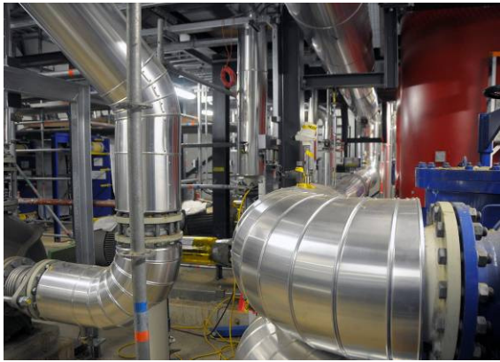
Afb. 2. De installatie van de technische systemen in de aardwarmtecentrale is gereed. In januari gaat de aardwarmtecentrale in bedrijf.